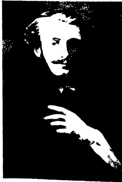
حوستاف فيود أخو بيير لوتي الذي أثر في حياته تأثيراً قوياً